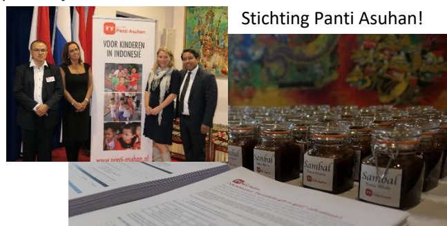
Stichting Panti Asuhan!