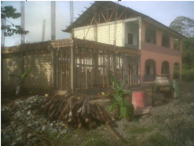
Het Antonius college verder in aanbouw .... Stand Januari 2014