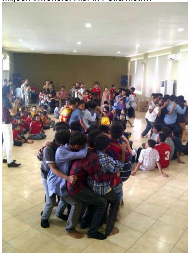
Een training in gemeenschapsgevoel...