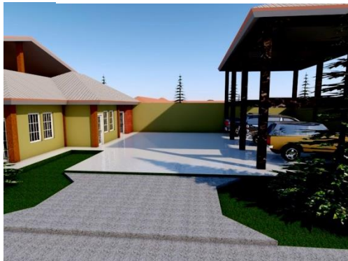
Ontwerp opleiding tot garagewerknemer